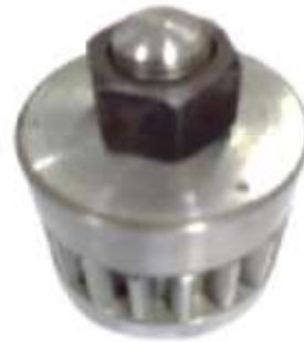
Gambar 4. Assembly real gear fixture posisi horizontal