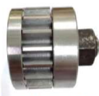
Gambar 3. Assembly real gear fixture posisi horizontal