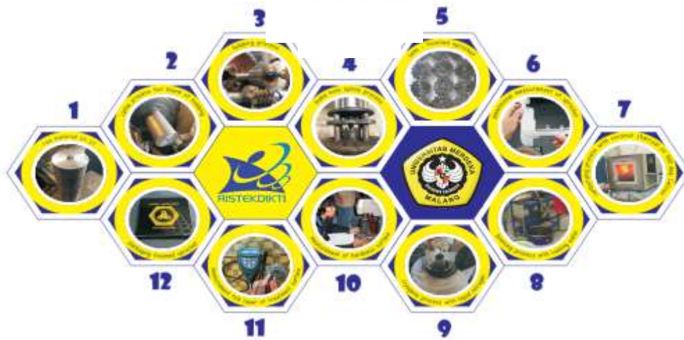
Gambar 1. Diagram alir pembuatan gear